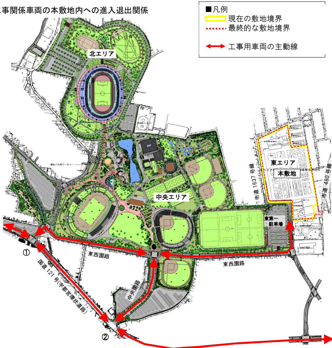
総合スポーツゾーン公園基本設計平面図

※ 工事関係車両は、国道121号（宇都宮環状道路）の①又は②交差点を利用し、園路（東西園路・中央園路）、市道1637号線を経由の上、本敷地に進入退出すること。