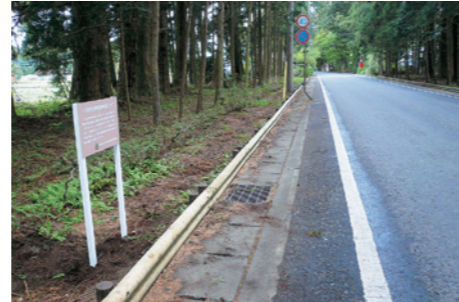
踏込防止柵 (会津西街道)