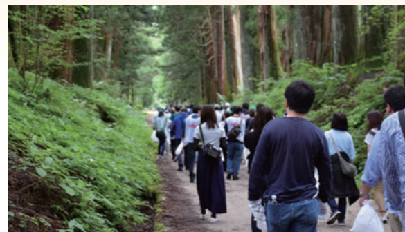
◇ウォーク&クリーン作戦の様子◇

また、令和元(2019)年10月21日に、グラクソ・スミスクライン(株)の従業員の皆様による日光杉並木清掃活動が行われました。