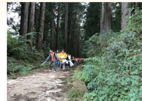
◇日光杉並木清掃活動の様子◇