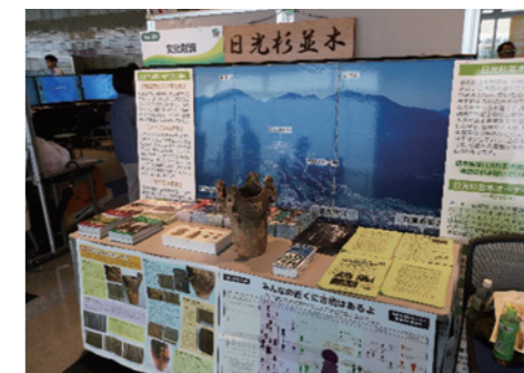
◇栃木県民の日記念イベント◇ (本館15階)