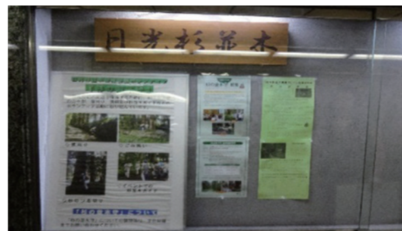
◇本町地下道横断歩道内での広告展示◇