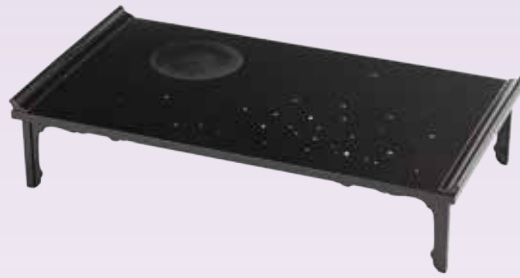
武蔵野図蒔絵文台(大正天皇御物) 日光二荒山神社(栃木県日光市)