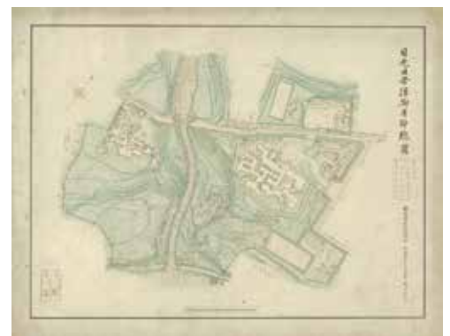
日光田母沢御用邸絵図 宮内公文書館(東京都千代田区)