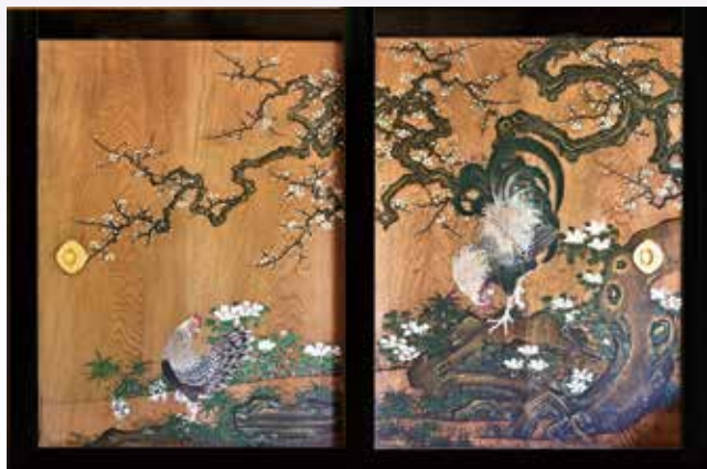
杉戸絵「白梅二鶏」遠坂文雅筆 日光田母沢御用邸記念公園(栃木県日光市)