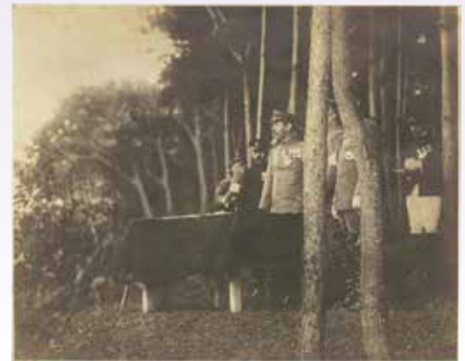
明治天皇御写真