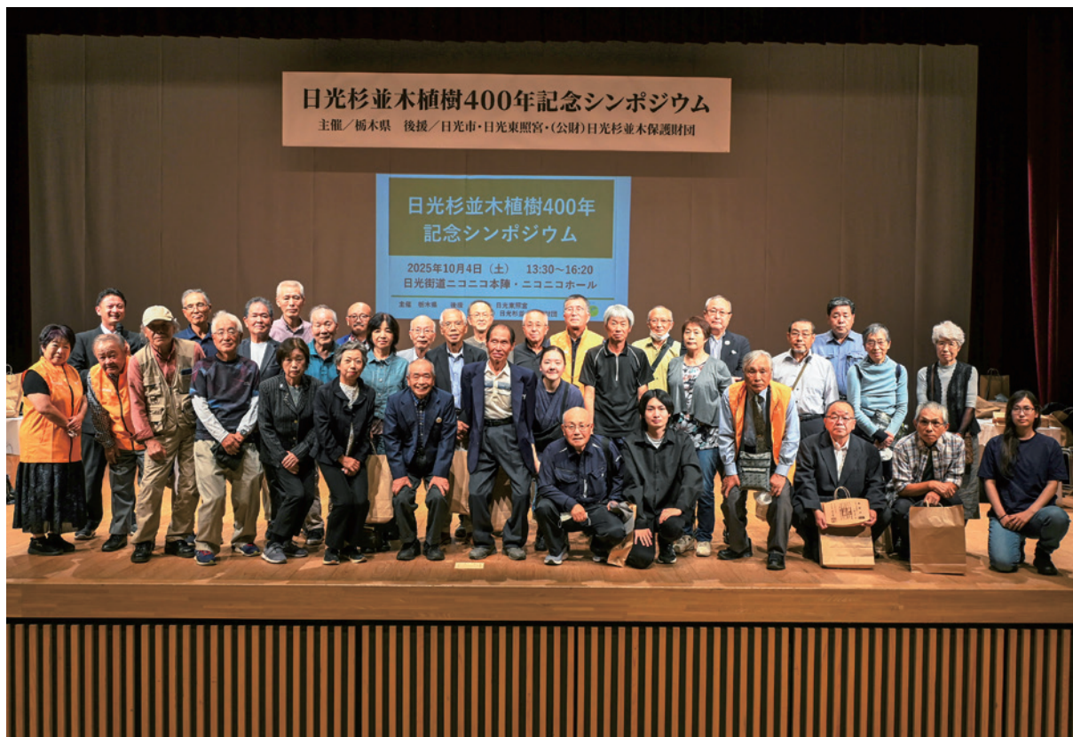
日光杉並木植樹400年記念シンポジウム（令和7年10月4日） 「杉の並木守」の皆様へ感謝状を贈呈させていただきました。