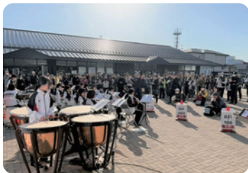
オープニングイベント

オープニングイベントでは日光市立大沢中学校吹奏楽部の生徒の皆様や日光江戸村様にご出演いただいたほか、休憩ポイントでは日光を味わえる飲食店等が出店しました。ゴールした方には、記念品をプレゼントしました。