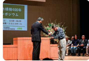
「杉の並木守」への感謝状贈呈