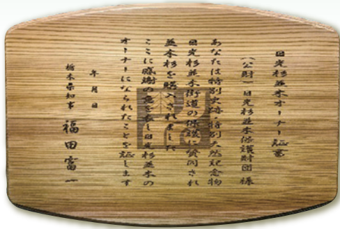
オーナー証書レプリカ

「日光杉並木オーナー制度」とは杉並木保護に賛同された皆様に並木杉1本につき1千万円でオーナーになっていただき、その代金を栃木県が「日光杉並木街道保護基金」で運用し、その運用益で並木杉の樹勢回復事業等を実施するという制度です。