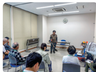
「杉の並木守」養成講座