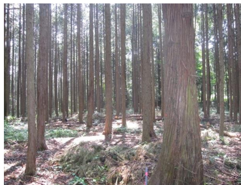
間伐を実施した結果、陽光が地表まで差し込むようになりました。