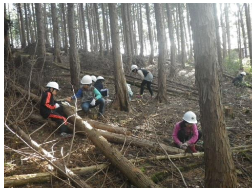
森林教室が開催されました。 (大田原市)