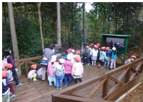
木造展望台設置 (大田原市 ふれあいの丘自然観察館)

公共施設等の木造・木質化(9市町)、奥山林間伐材及び里山林整備により発生した間伐材の有効利用促進(6市町)、木工教室など地域での木の良さ普及啓発等(15市町)を支援しました。