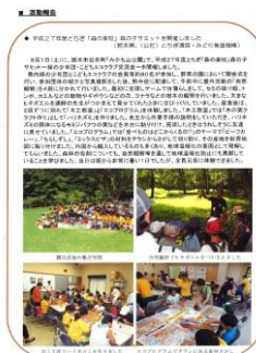
グリーンウェーブ