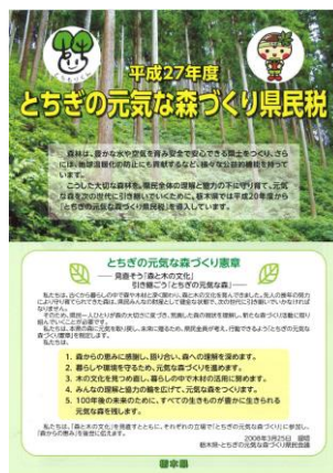
普及啓発用パンフレットを作成しました。