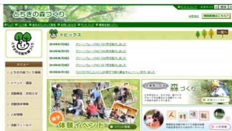
ホームページ「とちぎの森づくり」