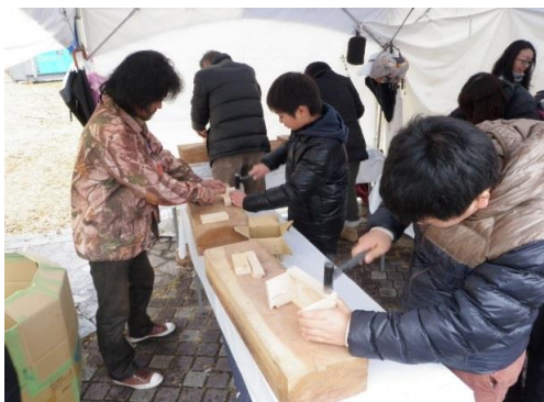
木工教室が開催されました。 (日光市)