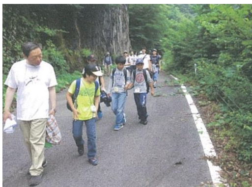
トレッキングツアー、講師養成などの人材育成等に対し支援しました。 (日光市湯西川)