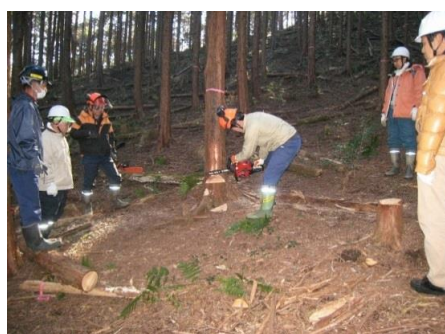
森の手入れ・間伐を実施しました。 （宇都宮市森林公園）