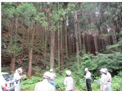
事業実施箇所の現地調査 (那珂川町)

委員会を2回（うち現地調査1回）開催し、平成26年度事業の検証・評価を実施しました。