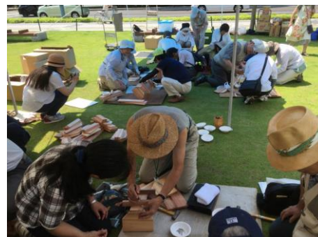
木工教室を実施しました。 （県民の日イベント：県庁前広場）