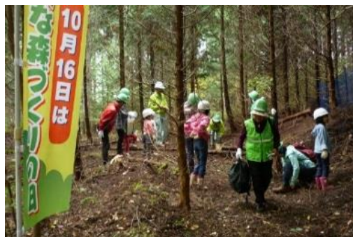
森づくり体験活動を実施しました。 （森づくりの日記念イベント：矢板市内）