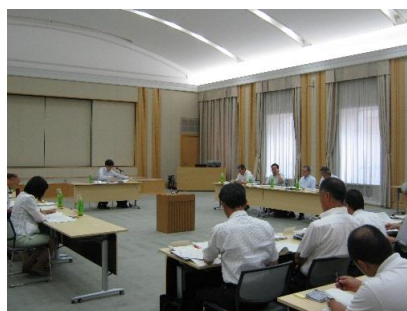
報告書取りまとめ (栃木県庁東館講堂)