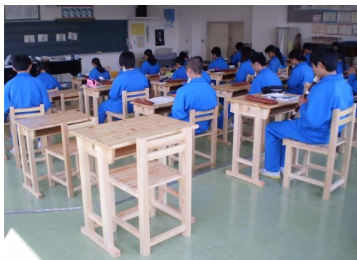
木製学習用机・椅子の使用状況 (佐野市立田沼東中学校)