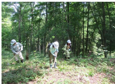
下刈体験を実施しました。 （益子町益子の森）