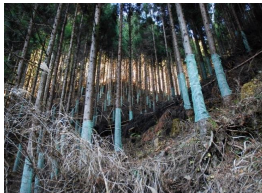
樹木に被害防止資材を巻き付けました。