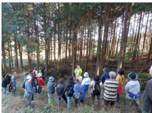
バスツアーを実施しました。 (那珂川町)

リーフレットの作成・配布、テレビ・ラジオ等での広報、税事業実施箇所を県民の皆さんにご覧いただくバスツアーなどを実施しました。