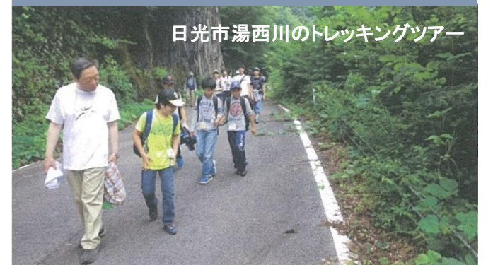
日光市湯西川のトレッキングツアー