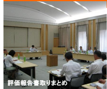
評価報告書取りまとめ