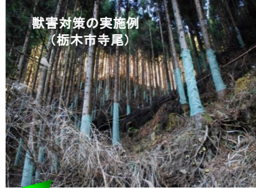
獣害対策の実施例 (栃木市寺尾)