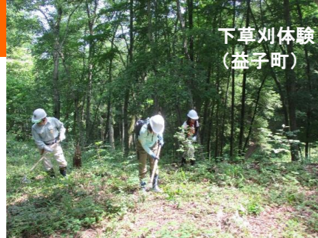
下草刈体験 (益子町)