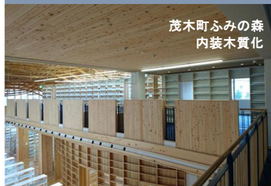
茂木町ふみの森 内装木質化