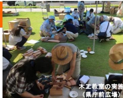
木工教室の実施 (県庁前広場)