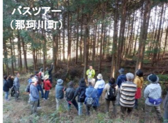
バスツアー (那珂川町)