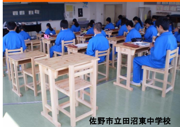
佐野市立田沼東中学校