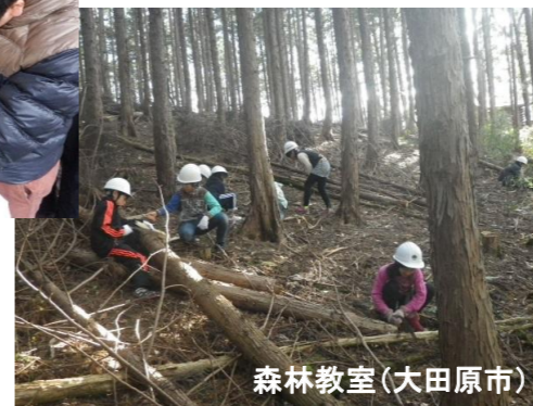
森林教室(大田原市)