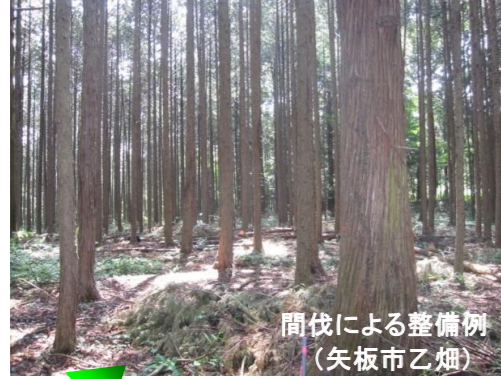
間伐による整備例 (矢板市乙畑)