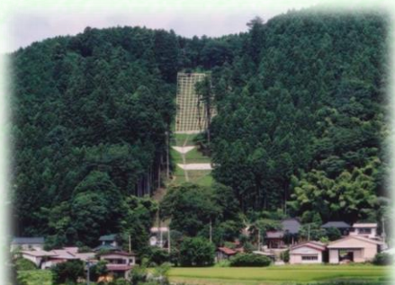
土砂流出防備保安林（那須町）

保安林には、土砂の流出を防ぐ「土砂流出防備保安林」、雨を貯えて洪水や濁水を防ぐ「水源かん養保安林」など、その種類に応じて様々な役割があります。