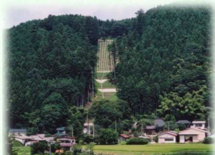
土砂流出防備保安林（那須町）

保安林には、土砂の流出を防ぐ「土砂流出防備保安林」、雨を貯えて洪水や濁水を防ぐ「水源かん養保安林」など、その種類に応じて様々な役割があります。