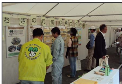
パネルを見ながらクイズに挑戦！ (とちぎグリーンフェア)

クイズでは、展示したパネルから答えのヒントを探すなど、楽しみながら「元気な森づくりの日」や「とちぎの元気な森づくり県民税」に対する理解を深めていただきました。