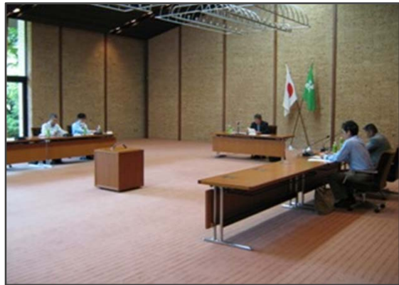
検討会の状況（県公館大会議室）