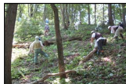
下川作業体験講座 (益子の森)

森林に親しんだり、森づくり活動を行う人材の育成を図るための体験講座を開催したり、子どもたちの森林環境学習のための資料作成や指導者育成などを行います。