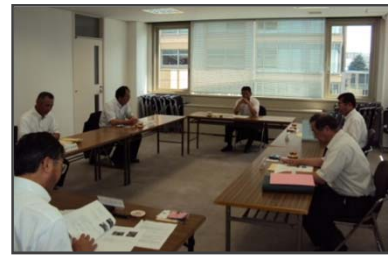
部会での協議の状況 (県庁研修館301研修室)