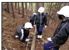
森林作業体験 (塩谷町)

市や町が行う、市民やボランティアを対象とした森づくり活動、子どもたちの森林環境学習などを支援します。