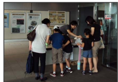
御家族でクイズに参加いただきました (栃木県保健環境センター公開デー)