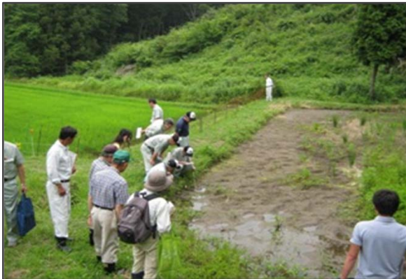
里山林整備事業（生物多様性モデル林整備事業） 実施箇所を調査する委員

とちぎの元気な森づくり県民税により実施する事業の透明性・公平性を確保するとともに、事業の推進に必要な事項を検討するため、とちぎの元気な森づくり県民税事業評価委員会を設置しています。