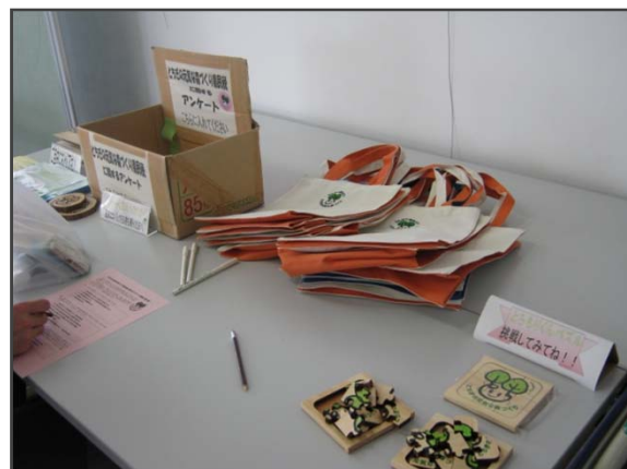
とちもりくんグッズは大人気！