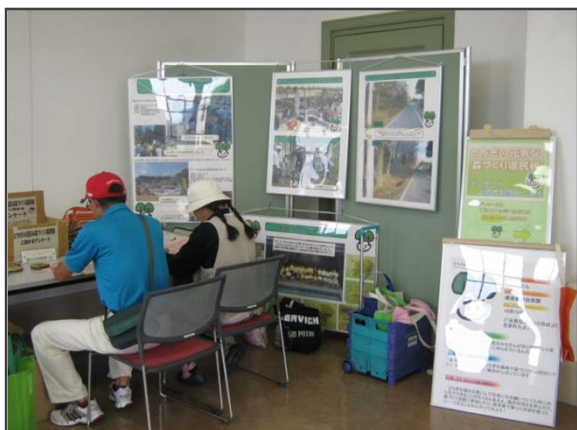
とちぎの元気な森づくりに興味津々！