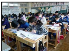
木製学習用机・椅子 (真岡市立長田小学校)

奥山林整備で発生した間伐材でつくった木製学習用机・椅子を小中学校へ、木製ベンチを多くの県民が利用する施設へ配布するほか、日光杉並木保護のための木柵としても活用します。