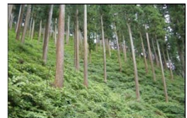
整備された健全な森林