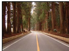
日光杉並木保護木柵 (日光市)