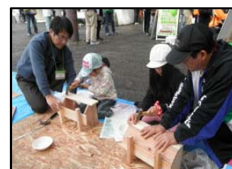
木づかい推進部会 による木工教室 (宇都宮市)

「とちぎの元気な森づくり県民会議」では、森づくり推進・木づかい推進・普及啓発の3つの部会を中心に、森づくり体験活動や木工教室など県民の皆さんに参加いただける身近な活動を通じて、県民協働の森づくりを推進しています。