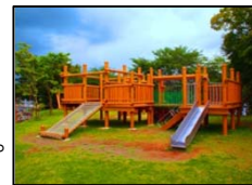
元気あっぷむらの 大型木製遊具 (高根沢町)

公共オープンスペースでの木材利用、公共施設の木造・木質化や地域における木の良さ普及活動などを支援します。