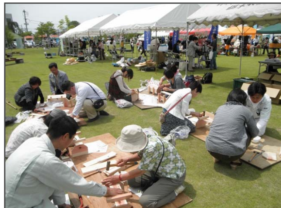
天候にも恵まれ、多くの方に参加いただきました