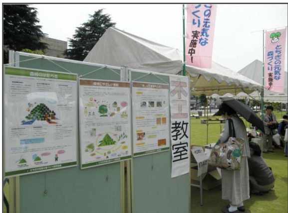
パネルにより森林の働きなどを展示

木のぬくもりや、ものをつくることの楽しさを実感していただくとともに、「とちぎの木」を使うことが、とちぎの森を元気にすることに繋がるということを学んでいただきました。