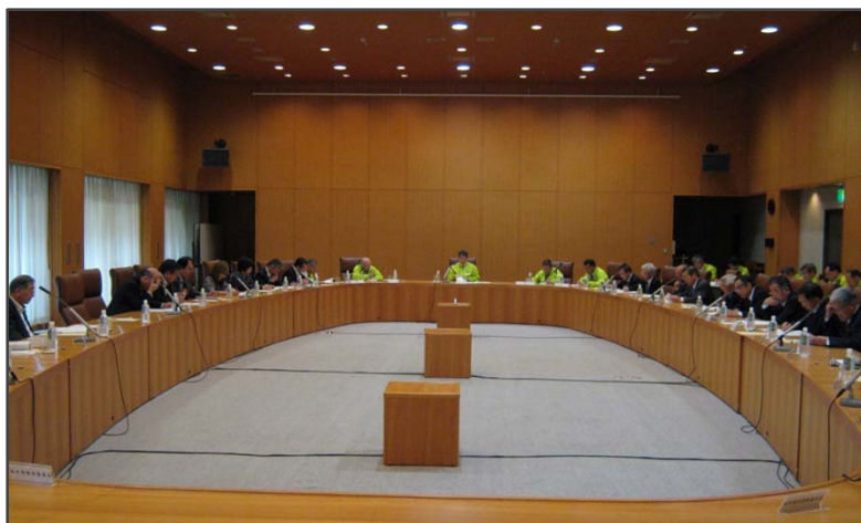
総会会場（総合文化センター）