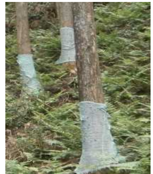
↓ 獣害防止資材の巻き付け（鹿沼市）