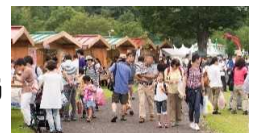
歓迎フェスティバル