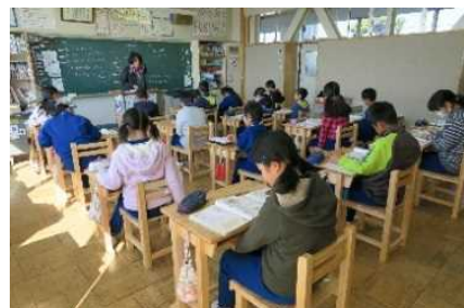
学習用机・椅子の配布(真岡市立大内中央小学)

奥山林整備で発生した間伐材を、小中学校に配布する学習用机・椅子の製作に活用するほか、日光杉並木保護のための木柵としても活用します。【机・椅子16,300セット、木製ベンチ2,000基】