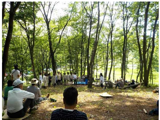
整備した里山林での音楽会（那珂川町）

野生獣被害が発生したり、発生する恐れのある田畑などに隣接する里山林を整備し、野生獣を人里に近づけないようにします。