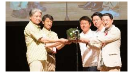
リレーセレモニー