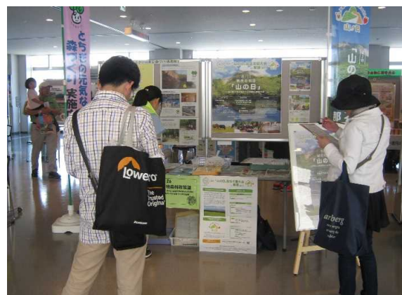
アンケートにご協力いただいた方に、とちもりくん グッズを配布。木製ペン立てやうちわが人気！

6月17日（土）の「県民の日記念イベント」において、とちぎの元気な森づくりに関するパネルの展示、県民税についてのアンケートを実施しました。約170名の方にお立ち寄り頂き、とちもりくんのクリアホルダーや木製ペン立て、うちわなどを配布し、とちぎの元気な森づくりの取組を知っていただく機会となりました。