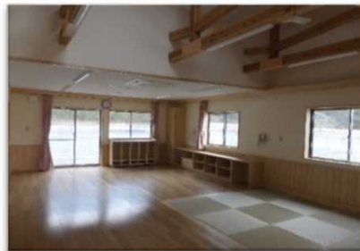
内装木質化(那珂川町立ひばり幼稚園)

森林の公益的機能の高度かつ持続的な発揮など、地域特性を活かした創意工夫のある市町提案事業に対して支援します。【取組数18】