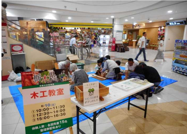
皆さん熱心に作成されていました！

皆さん楽しそうに作成されており、完成後は何を植えようか話されている参加者もいました。