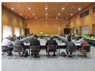
総会会場(総合文化センター)