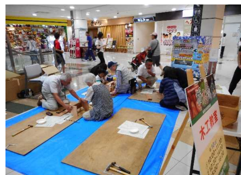
真剣に取り組む参加者

県産材のスギの間伐材を使ったプランターを45セット用意し、多くの親子連れに木工教室を楽しんでいただきました。