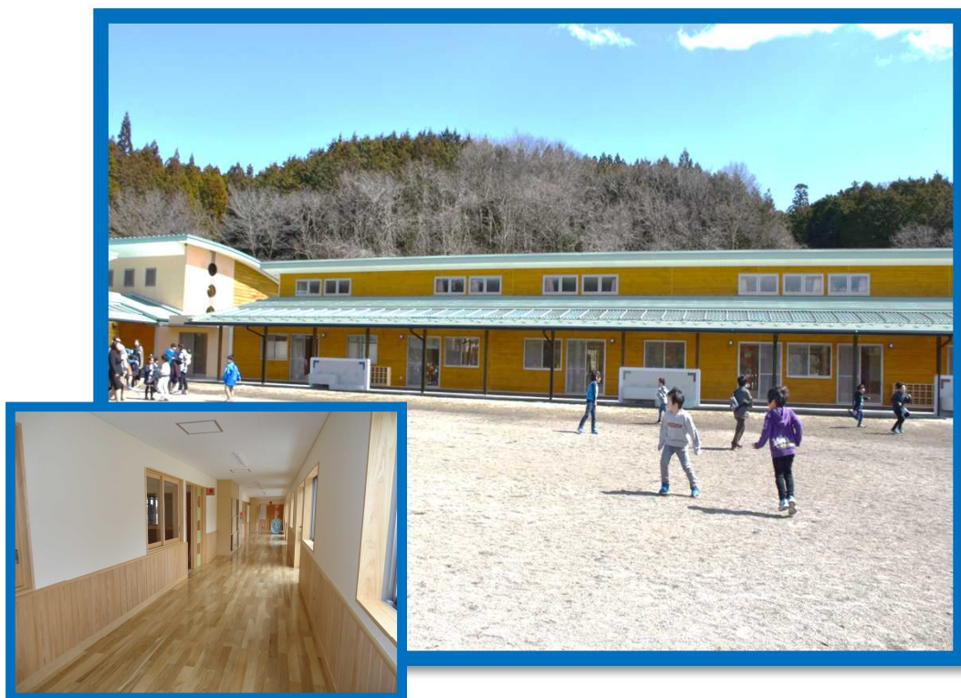
写真：認定こども園ひばり木造・木質化 （那珂川町和見） －平成28年度木の香る環境づくり支援事業－