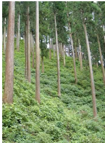
←間伐して整備された森林（鹿沼市）

平成20年度から平成28年度までの9年間で、約26,900ヘクタールの奥山林を整備しました。（全体整備目標：30,900ヘクタール）