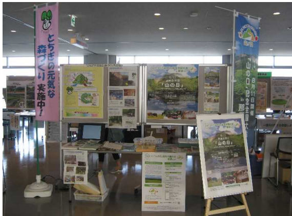
パネルを展示したり、 県民税事業紹介DVDを放映しました。