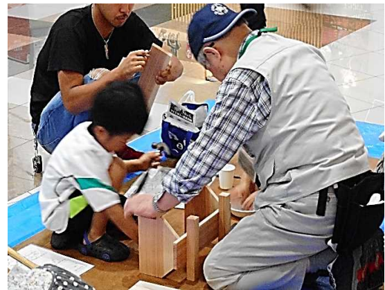
プランター作成の様子