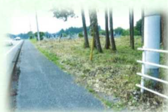
通学路周辺の整備 (日光市)

令和3(2021)年度は、 皆伐後の植栽 341ha 里山林の整備 958ha 地籍調査 816ha などの事業を実施しました。