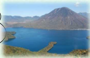
日光国立公園 (日光市)