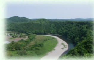
那珂川県立自然公園 (茂木町)