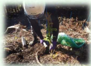
少花粉スギコンテナ苗の植栽 (日光市)

皆さんの御理解、御協力のもと、御負担いただいたとちぎの元気な森づくり県民税（個人：年額700円、法人：均等割額の7%）を活用し、県民協働による元気な森づくりを進めています。とちぎの元気な森づくり県民税はH20(2008)年度から導入され、長年手入れされていなかった森林の整備等を進めてきました。H30(2018)年度からは、森林の若返りのため、皆伐後の植栽の支援等に取り組んでいます。