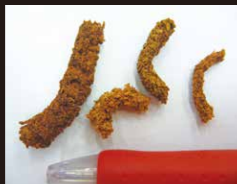
木くずと幼虫の糞が固まって かりんとう状となる