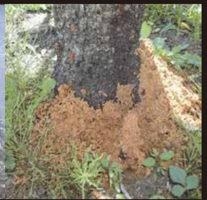
赤茶色のフラスが株元に積もったサクラ(左)とモモ(右)