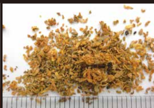
フラスの内容物にはノミで削ったような 薄い木くず片が含まれている