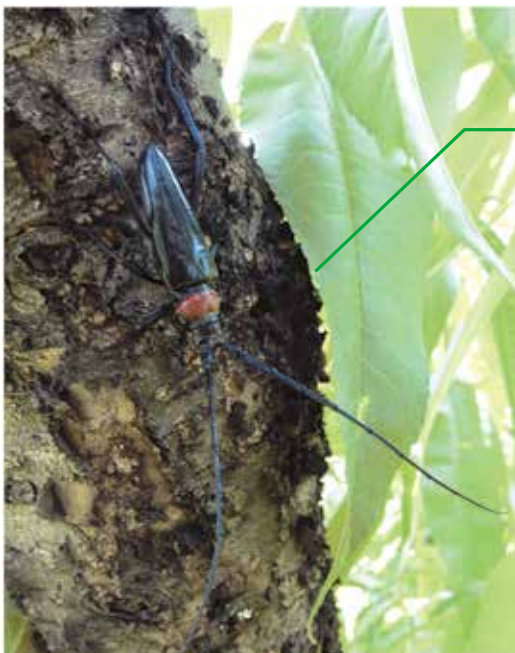
野外でのクビアカツヤカミキリ