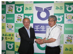
多賀城市長が町長訪問