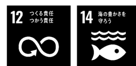
表 8. プラスチック資源循環と SDGs