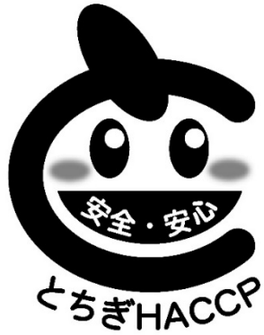
栃木県食品自主衛生管理認証施設のマーク