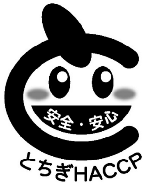
栃木県食品自主衛生管理認証施設のマーク