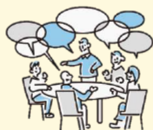
外来医療に関する地域の協議の場