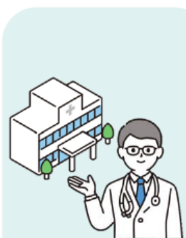
かかりつけ医機能報告 対象医療機関