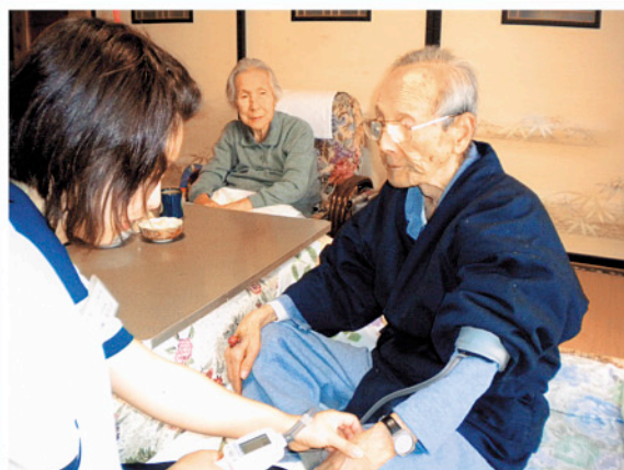
血圧・体温・脈拍などの観察の様子