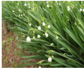
スノーフレーク (スズランスイセン)