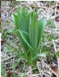
芽出し期のコバイケイソウ