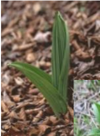
芽出し期のバイケイソウ