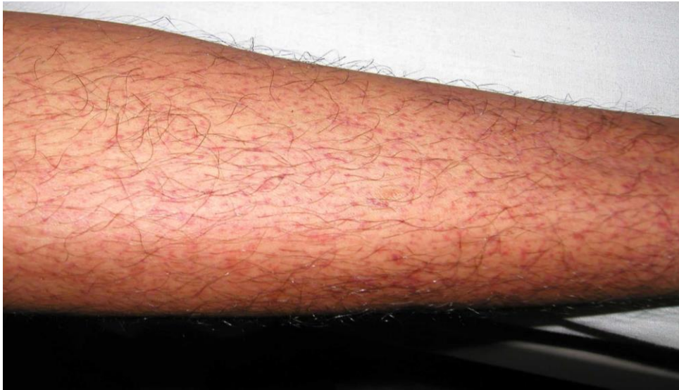
図 1. デング熱患者の発疹：解熱時期にみられた点状出血