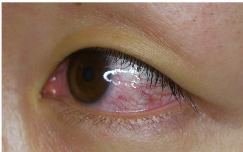
図 4. ジカウイルス病の充血性結膜炎

※ ただし、蚊媒介による国内発生を疑う場合は、1. をおこしうる他の疾患を除外した上で、2. の条件は必須ではない ( 2.1 デング熱②診断「鑑別診断」 を参照)。