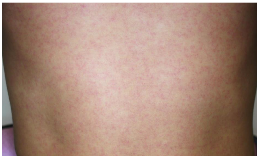
図3. ジカウイルス病の斑状丘疹様の発疹

潜伏期間は、2～12日（多くは2～7日）である。ジカウイルス病の臨床症状は多彩であるが、斑状丘疹様の発疹（ 図3 ）は90～100%に認められるのに対して、発熱の頻度は35～65%とされており 25,45,46 、またこの発疹は掻痒感を伴うことが多いとされている。なお、大半の症例は入院を必要としなかった。 表7 に2015年のブラジル・リオデジャネイロにおけるジカウイルス病患者が発症後4日以内に認めた臨床症状を示す 45 。