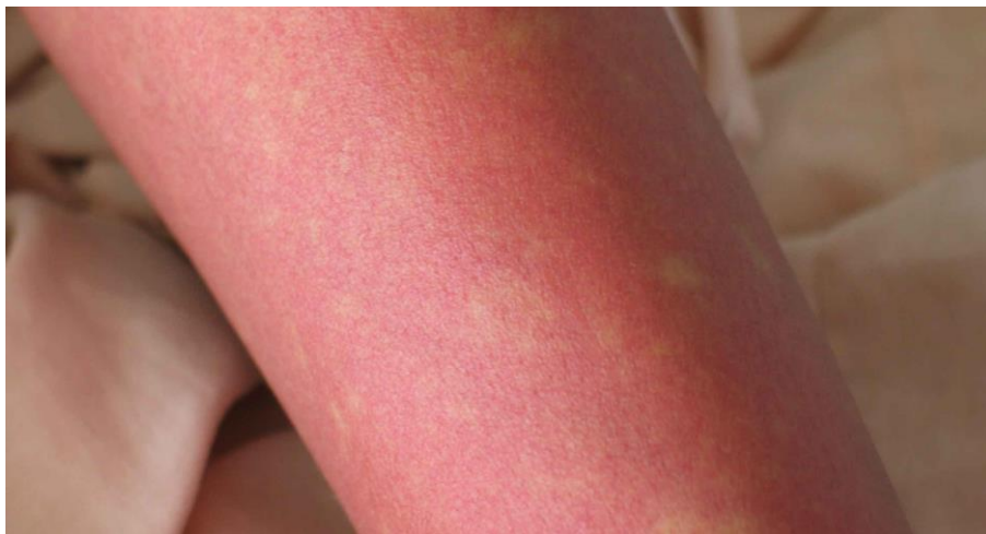
図 2. デング熱患者の発疹：解熱時期にみられた島状に白く抜ける紅斑