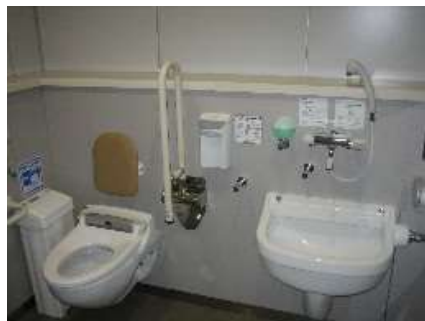
オストメイト対応トイレ（県庁舎本館 1 階）