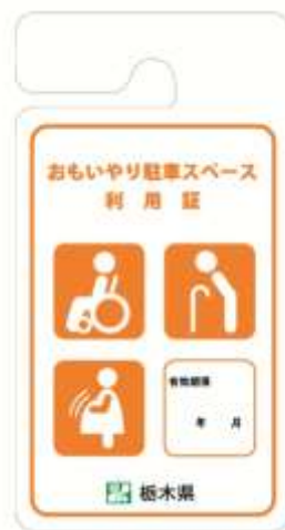
〔妊産婦・傷病人用〕