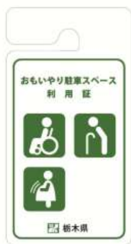
〔障害者・難病患者等用〕