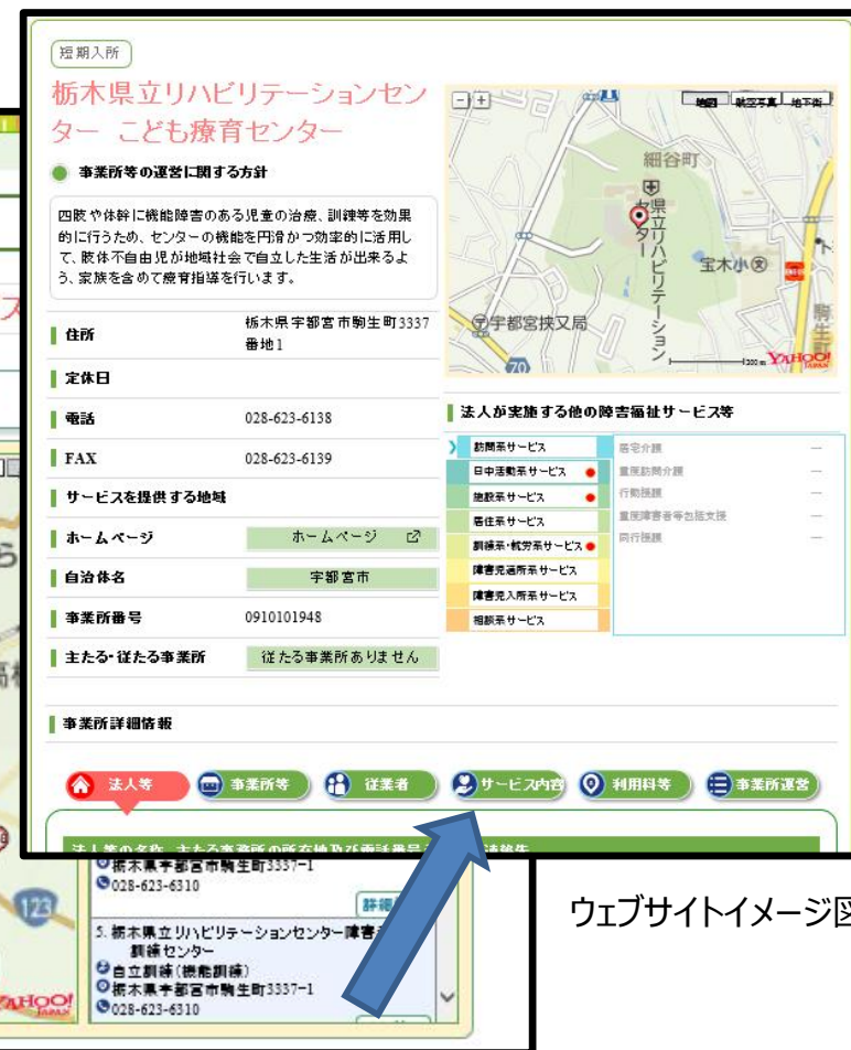
ウェブサイトイメージ図