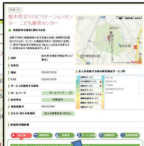
ウェブサイトイメージ図