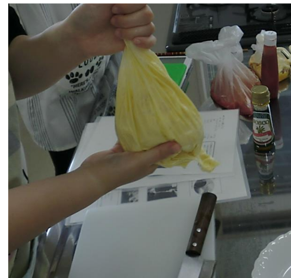
③具材をポリ袋に入れたら 味が染みるようよく揉み込みます