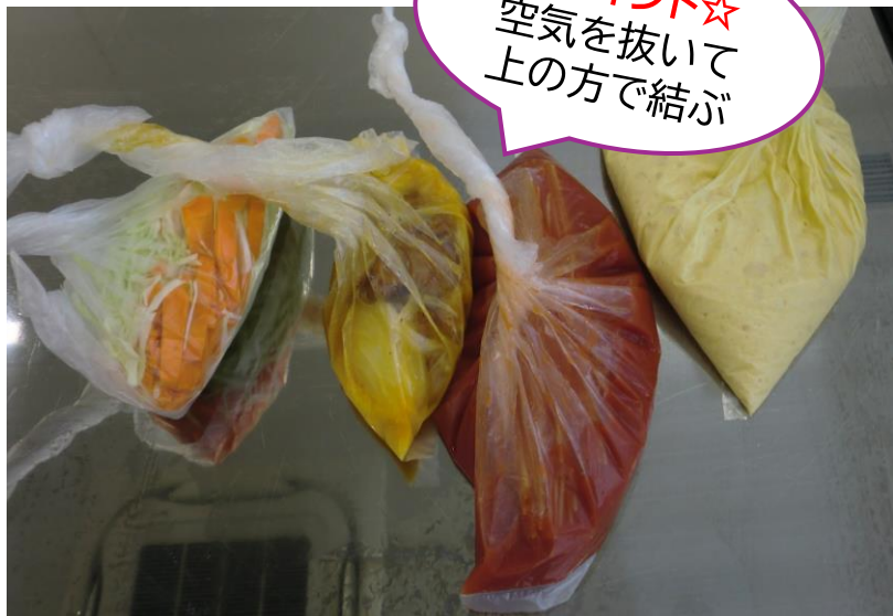
④料理毎にポリ袋に具材を入れます