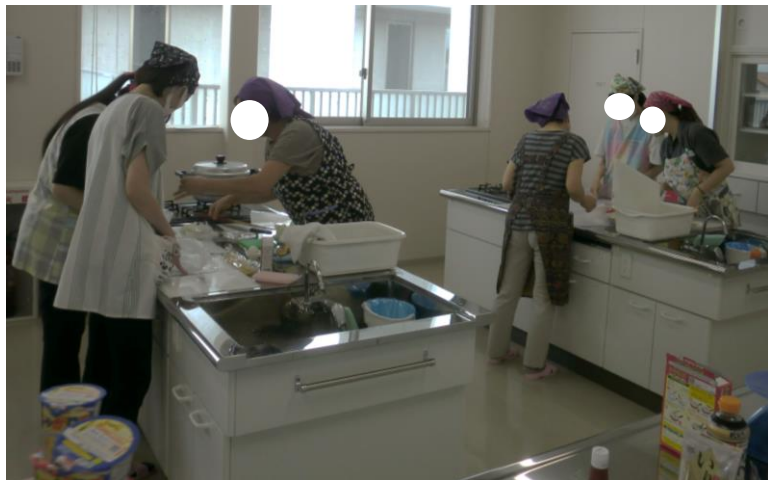
①具材・器具を用意します