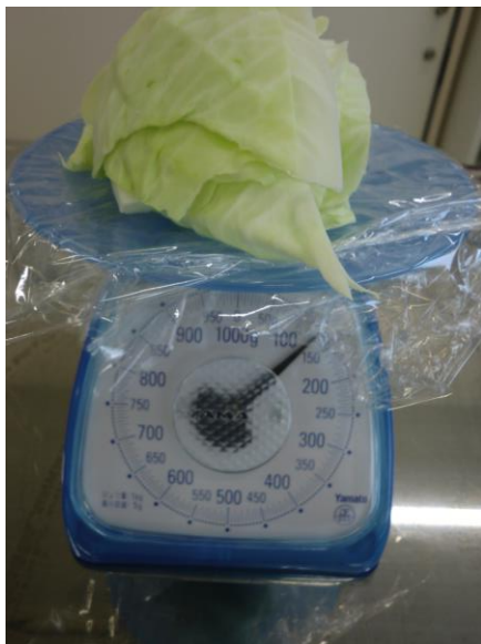
②具材の重さを量ります