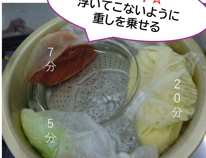
⑤大きな鍋にお湯を沸騰させてポリ袋を 加熱します(規定時間に合わせて)