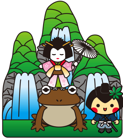
那須烏山市 やまあげ祭り