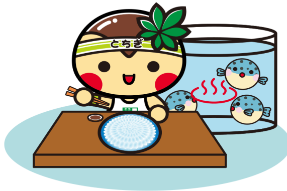
那珂川町 温泉とらふぐ