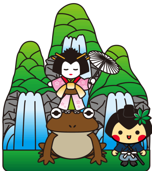
那須烏山市 やまあげ祭り