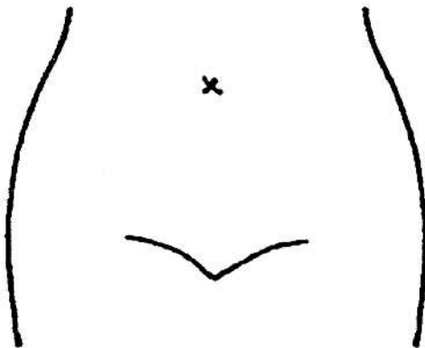
(腸瘻及びびらんの部位等を図示)