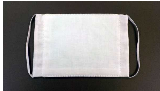
B 抗ウイルス性生地入 表