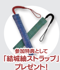
参加特典として 「結城紬ストラップ」 プレゼント!