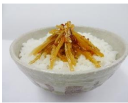
ごはんにかけるごぼうと昆布

現在、食の多様化により「若者の漬物離れ」が起きています。その中で幅広い年齢層に性別問わず好まれる商品がこの「ごはんにかけるごぼうと昆布」です。ごぼうを塩蔵してから使用することで、生のごぼうを使用するよりも歯切れの良いシャキシャキとした食感を出しています。また、通常青果で使用されるごぼうよりも細いサイズの原料を使用することで、皮の部分が多く入り、ごぼうの風味をより強く感じられる商品となっています。