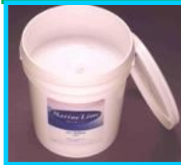
製品名: マリンライム

消石灰系塗り仕上げ材「マリンライム」は、施工性、安全性を重視した内装用壁材です。従来の漆喰と比べて、保水性に優れ、作業性が良く、天然海藻を使用したときのような特有な臭気や呈色がありません。予め水と混合したペースト状なので、開封後直ぐに施工でき、施工性に優れています。