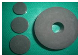
図2. 活性炭配合タブレット品