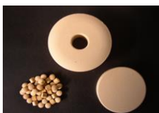
図1. 各種タブレット品

弊社で用いているアロフェンは火山噴出物由来の栃木県で採掘した天然の非晶質(低結晶性)アルミニウムケイ酸塩です。アロフェンの単粒子は外径3~5nmで、約0.5nmの構造欠陥(貫通孔)が多く存在した中空球状の特徴的な構造をしています。また、外壁と内壁には水酸基が存在しておりこれらの相乗効果で、①吸湿性、②調湿性、③吸着特性を有する物質です。このユニークな特徴を生かし、弊社独自の加工法で錠剤や顆粒品など形態を変えてニーズに合わせた商品を送り出しております。