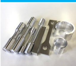
試験片(テストピース)

わが社の《航空機・自動車部品等からのアルミ試験片加工》にはこんな特徴があります！