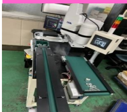
自動測定システム

開発製品の特長である機器全体は小型化を志向し、架台単位で移動可能とする等、1台の設置面積3㎡で十分に精密で迅速な検査作業が実現した。