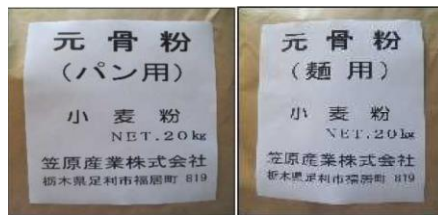
商品名:元骨粉(パン用・麺用)

食生活における慢性的なカルシウム不足を補うため、摂取効率の良い理想的なバランスのカルシウムとマグネシウムを2:1の割合で小麦粉に混合しました。日常多く食されるパン用、麺用の粉としてお使いいただけます。