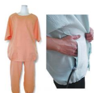
手術後用パジャマ

わが社の《次亜塩素酸ナトリウム消毒でも退色しない堅牢度の高い建染染色》にはこんな特徴があります！