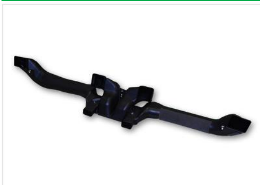
エアコン向けダクト