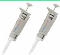
製品名:ITピペット Qシリーズ

従来のブローアウト機能では、微量の試薬を排出する時の吐出力が弱い為、チップ内に残留した液と使用済みチップを一緒に廃棄されており研究コストが圧迫される要因の一つでした。弊社では、ブローアウト容積を増幅させることで、完全に吐出することが可能となり、サンプルを膜状に引き戻すことはありません。