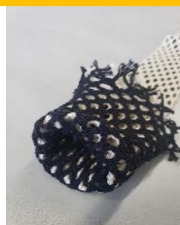
レイヤーチューブ

当社が開発した「レイヤーチューブ」は筒状で多重構造になっており、無縫製でデザイン性、機能性共にこれまでにない製品に仕上がっております。モノを包んで強度を持たせたりすることが可能ですので、ファッションの他にも産業資材向けなど様々な用途にご利用いただけます。