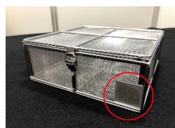
(スマートコンテナ)

オーダーサイズでステンレス製のコンテナを製作いたします。 数量: 1個から量産まで。 形状: 角型・丸型・薄型・小型・大型など。 提案: 現状の改造、製作方法の変更、機能追加、コスト低減等。 コンテナ側面にQRコードを取り付け。生産管理システムと連携することで、コンテナ内容物の種類や個数、洗浄時間等の工程情報を端末に表示することができます。 「スマート洗浄カゴ®」(登録商標 第6412766号)