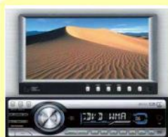
カーナビ・カーオーディオ 関連部品