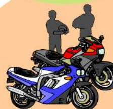
オートバイ関係部品