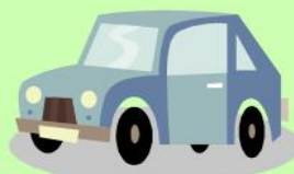
車のプレス部品全般