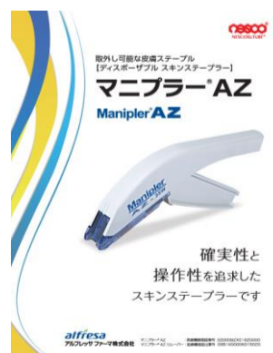
マニプラーAZ(皮膚縫合器)