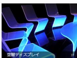
空機ディスプレイ