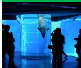
アザラシのトンネル水槽