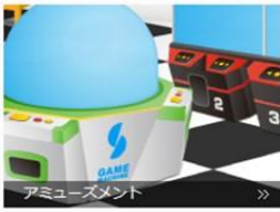
アミューズメント