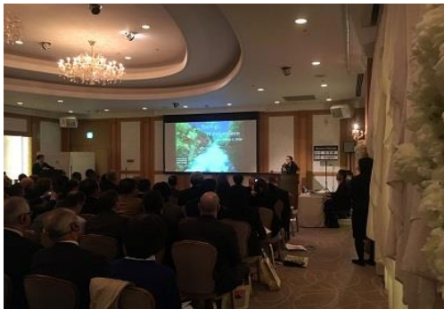
▲ 国際交流員によるプレゼン

12月5日(水)にホテル椿山荘において、外務省との共催により「地域の魅力発信セミナー」を開催しました。約200名の駐日外交団に対して、交通利便性や災害の少なさ及び首都圏最高水準の補助金制度など、栃木県の投資環境の優位性についてPRしました。このように本県では、立地環境を生かした企業誘致の推進を図っているところです。「とちぎびと」の皆様におかれましても、身近なところで「とちぎ」の魅力のPRにご協力をお願いいたします。また、外国企業の県内誘致について、ご意見やアドバイスがありましたら是非お寄せください。補助金の概要等を記した産業団地案内のご希望がありましたら送付しますので併せてご連絡をお願い致します。