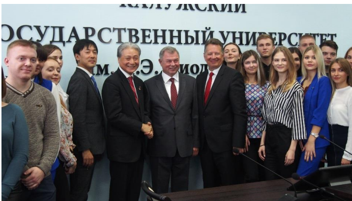
▲カルーガ国立大学でアルタモフ知事、学長、学生らと意見交換

カルーガ州には2日間滞在し、現地の産業団地や日系企業の視察、大学訪問をするとともに、両県州間の交流促進に向けてアルタモフ知事と意見交換を行いました。