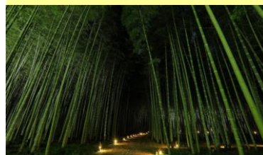
▲宇都宮市にある若山農場の竹林ライトアップ