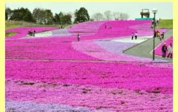
▲市貝町芝ざくら公園