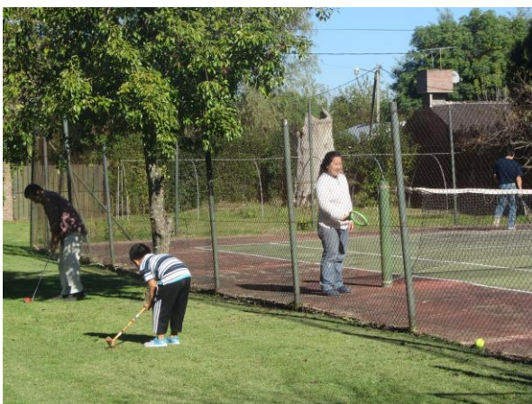
▲会員同士のテニスでの親睦