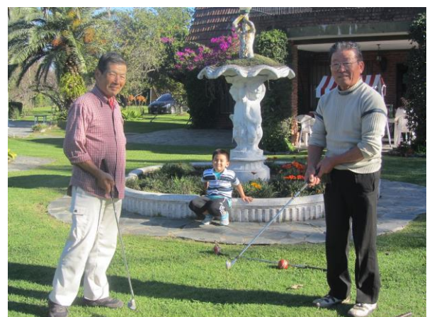
▲会員同士のゴルフでの親睦