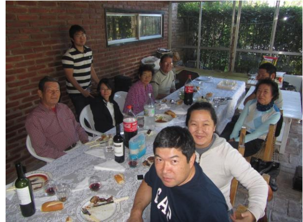
▲総会後の会員との昼食会の様子