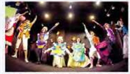
日本を拠点とする劇団「仮想定規」は、オリジナルミュージカルを中心に活動

145 6th Ave. kasoujiyougi.com here.org/shows/after-ever-happily-ever-after