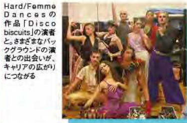
Hard/Femme Dancesの作品「Disco biscuits」の演者たち。さまざまなバックグラウンドの演者との出会いが、キャリアの広がりにつながる