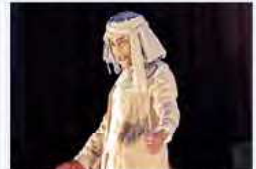
今回の演目は、これまでも国外で、英語字幕付きで上演されてきた