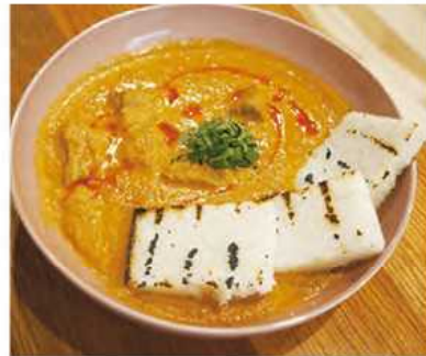
チーズ、卵、バターをかき混ぜる店員のパフォーマンスが人気の「Adjaruli(写真中央)」は、ジョージアの伝統料理