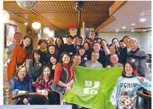
昨年12月に開催した忘年会の様子

益子(ましこ)焼 …300以上の窯元・陶器店があり、作風も多種多様で「芸術品」として世界的に知名度を上げている。毎年、春と秋に開催される陶器市では、40万人以上が来場。今春は4月29日～5月6日に開催予定。