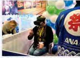
VRを駆使したフライト体験をはじめ、食品や記念撮影、文化体験のコーナーが各ブースに登場