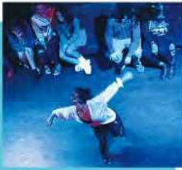
体験型シアター作品「Pansy Craze」に出演した時の様子。大変だが達成感のある仕事だ