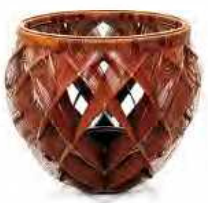
大分県の誇る精巧な竹細工 Tatebe Kouchikusa

「Eラーニング」は2月17日(月)〜21日(金)の午前10時〜正午に、英検に向けての面接準備と、6月の英検レベルにむけての紹介を行います。参加無料。事前申し込み不要。同校は「リスニング」会談、試験、語彙「リスニング」イベントを総「Eラーニング」 合法的に学習するカリキュラムで、英検やTOEFLの個人指導などを行う。 【場所/問い合わせ】 136 Palmer Ave., Suite 300 Manassas, NY 10543 TEL: 914-574-9316 eflearning@live.com eflearning.com