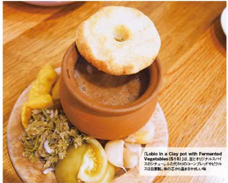
[Lobio in a Clay pot with Fermented Vegetables ($16)]は、豆とオリジナルスパイスのシチュー。ふた代りのコーンブレッドやピクルスは自家製。体の芯から温まるやさしい味