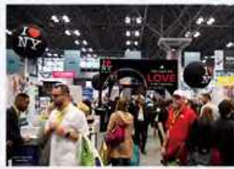
地元ニューヨーク州もアップステートを中心に、マンハッタンの人々に観光をアピール