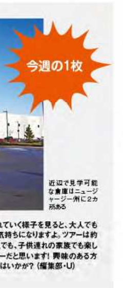
近辺で見学可能な倉庫はニュージャージー州に2カ所ある

ニューヨーク州のアン・クオモ知事は、2021年度行政予算の一部として、電動自転車と電動キックスクーターを合法化する法案を州議会に提出した。州全域での電動自転車と電動キックスクーターの包括的な安全対策が含まれる23日付ABC7ニューヨークが伝えた。 クオモ知事は「ニューヨークは、混雑の原因であり、環境を破壊する自動車に代わる交通手段を必要としている」と述べた。 「地球に優しい電動自転車や電動キックスクーターは代替手段として有望だが、使用者と歩行者、ドラ