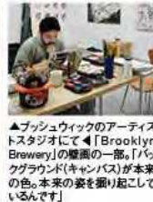
▲ブッシュウィックのアーティストスタジオにて「Brooklyn Brewery」の壁画の一部、「フッククラウド」キャンバスが本来の色。本来の姿を振り返りてみる