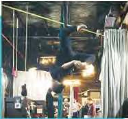
プライベートでは、「The Muse Brooklyn」で、エアリアルパフォーマンスを練習中