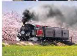
陶芸の里 益子町へは 真岡鉄道の「SLもあ号」で