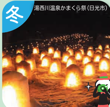
湯西川温泉がまくら祭（日光市）