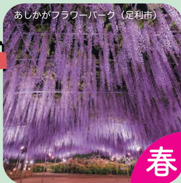
あしががフラワーパーク（足利市）