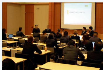
令和7年度の成果報告会の様子