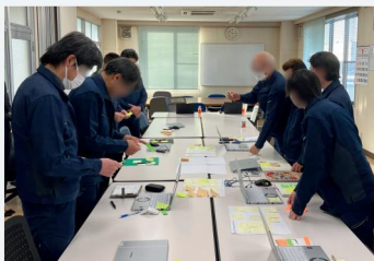
ユニ工業株式会社のカエル会議®の様子

3600社以上の実績をもとに、1社1社の課題に合わせて、 専門コンサルタントが、伴走支援いたします。