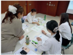
令和7年度の養成講座の様子

自社の働き方改革の推進員として必要な知識を学び、変革を牽引できる スキルを身につけます。(1社2名以上での参加がお勧めです)