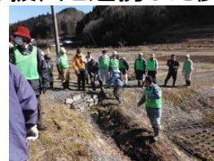
●実施事業: 中山間地域人材養成・活用事業 (中山間地域元気創出事業)