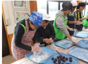
●実施事業: とちぎ夢大地応援団カレッジ(中山間地域元気創出事業)