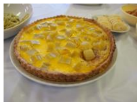
●実施事業: 地域活動サポート支援事業 (中山間地域元気創出事業)