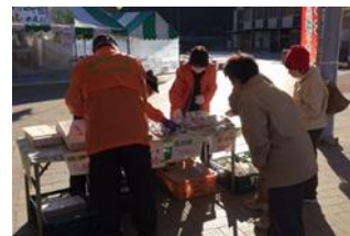
●実施事業: 中山間地域実践活動支援事業(中山間地域元気創出事業)